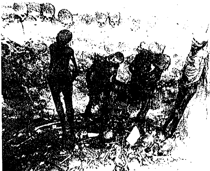
Angle Nord-Est de l'ossuaire. Les Mandulons et la corniche-présentoir.